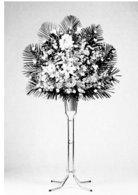
◆生花 スタンド1段式